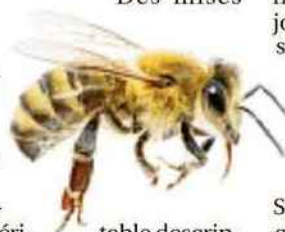
table descriptif de la vie des abeilles. Leur classification. Un focus sur "l'agroécologie". Une critique, légère dans la forme mais acerbe sur le fond, de notre société et de ses dérives écologiques, qui seraient autant de

mises en danger de la vie. Tout ça dans un petit livre, format poche, que rien ne vous empêche de trimballer avec vous, histoire de le butiner au fil du jour et d'en savoir un peu plus sur cet insecte rayé. Et majeur.